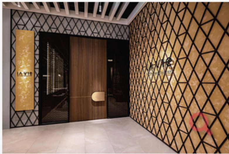
Der Eingangsbereich des La Vie by Thomas Bühner