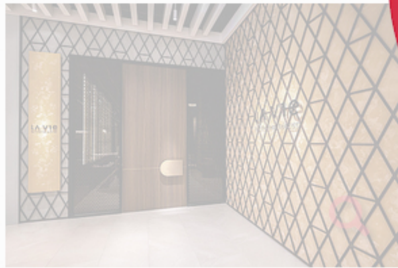
Der Eingangsbereich des La Vie by Thomas Bühner