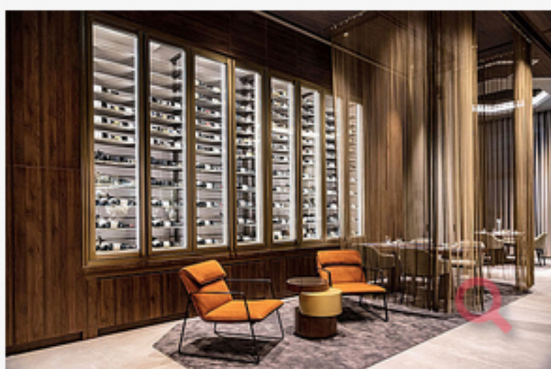
Die Wein-Lounge des La Vie by Thomas Bühner