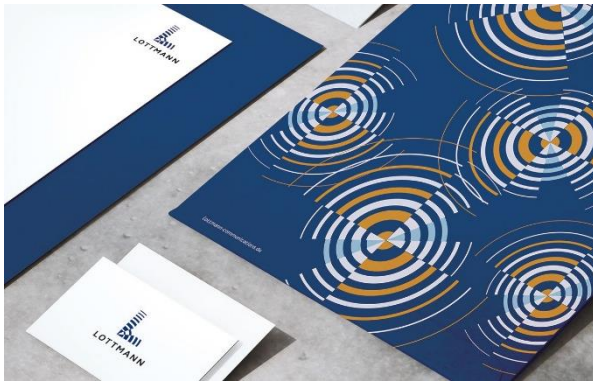
Relaunch Corporate Design for Lottmann Communications