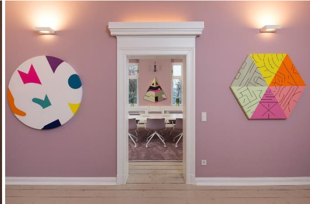
Office Kitzig Design Studios, Lippstadt