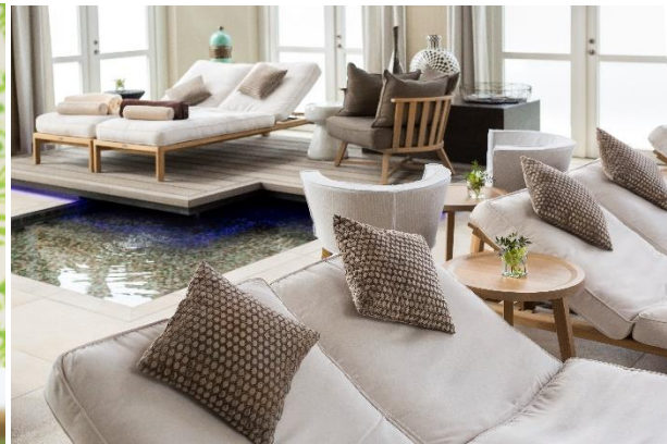
Spa Schloss Fleesensee