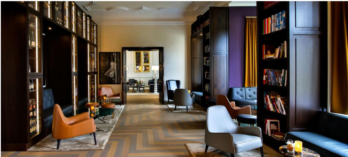
Lounge Schloss Fleesensee, Photo by Christian Laukemper

Dieses umfassende Know-How macht Kitzig Design Studios international zu einem starken, zuverlässigen Partner, was durch einen nationalen wie internationalen Kundenstamm bestätigt wird.