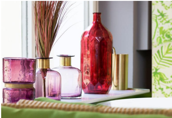
Cafe Kakadu

führt das Büro Kitzig Details. Bereits 2007 übernahm sie im Team von Kitzig Interior Design als Materialmanagerin die Koordination, Auswahl und Beschaffung von Produkten und Materialien. Aus der stetigen Weiterentwicklung des Aufgabengebiets und einem breiten Netzwerk entstand das Unternehmen Kitzig Details.