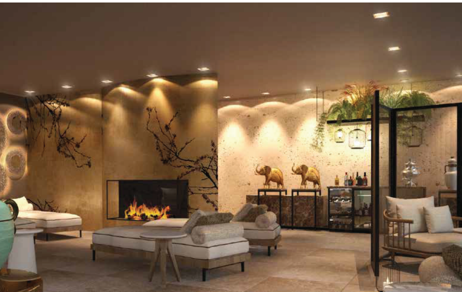
▲ Raumkonzept mit Kamin und asiatisch angehauchten Daybeds / Room concept with open fireplace and asian-themed daybeds

The discreet colors in different natural shades allow the guests to unwind from the everyday hustle and bustle. The four elements are playfully blended into the scene, among other, with an open fireplace in the middle of the room, as well as the views of the countryside. Asian-themed daybeds complete the room concept.