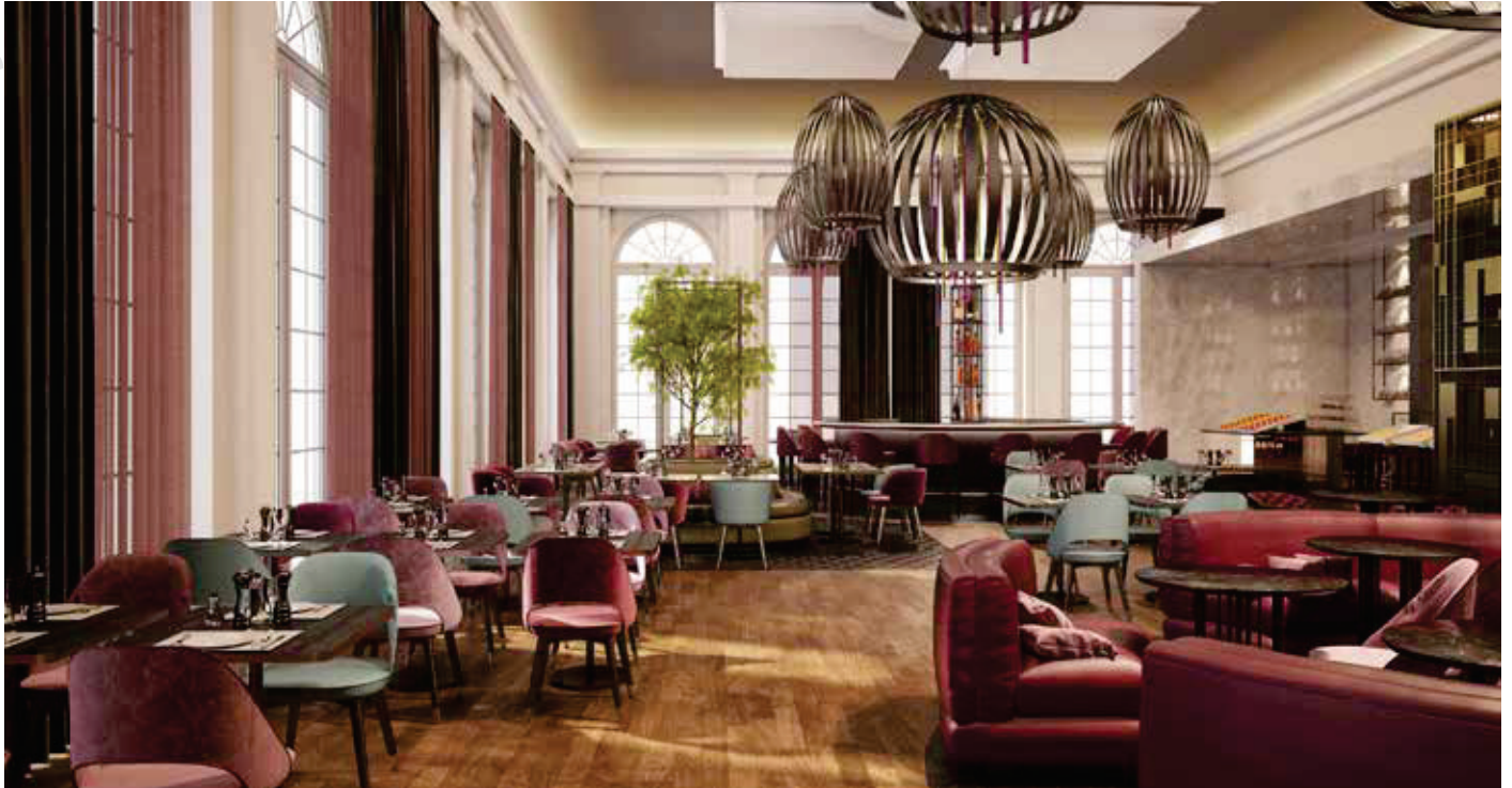
▲ Inneneinrichtung im Stil der 50er-Jahre harmoniert mit dem Barockstil des Gebäudes / Furnishing in 50s style chimes in with the Baroque style of the building

After a complete renovation, a baroque country house hotel was complemented with a luxury spa and an orangery