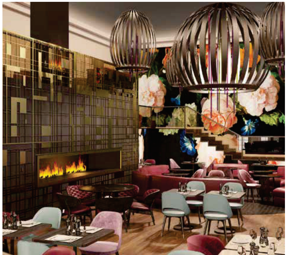
▲ Ausladende Lampenschirme schaffen stilvolle Akzente / Wide lampshades are chosen in style

Guests are already highly impressed upon entering the spa area: high ceilings and an extraordinary interior design harmonize with the large window fronts, which have been preserved from the old building. These allow for a lot of natural light and are reminiscent of the centuries-old history of the building.