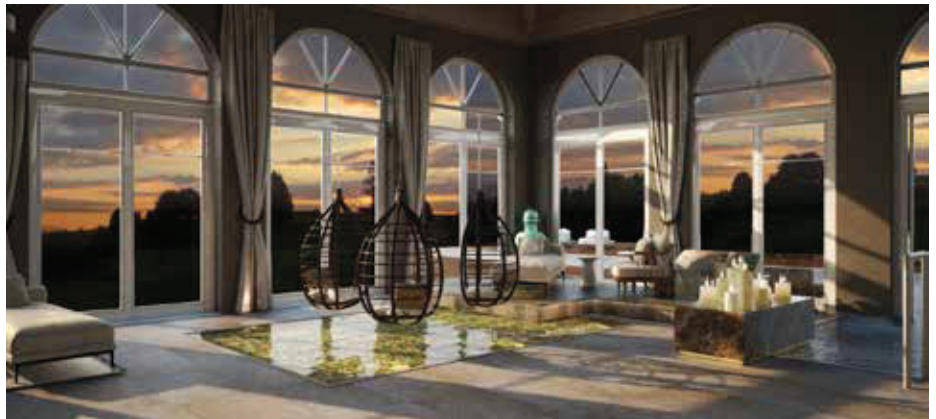
▲ Großflächige Fensterfronten bieten Ausblick in die Natur / Large window fronts offer a great view

Farblich auf die Tapete abgestimmt zeigt sich das Mobiliar, welches die Leichtigkeit der beeindruckenden Raumhöhe widerspiegelt. Für einen Bruch in der Höhe sorgen ausladende Lampenschirme, die zugleich stilvoll Akzente schaffen. Ein weiteres Highlight ist der offene Kamin. Dieser wurde in eine individuell gefertigte Verblendung integriert und sorgt für ein wohliges Ambiente.