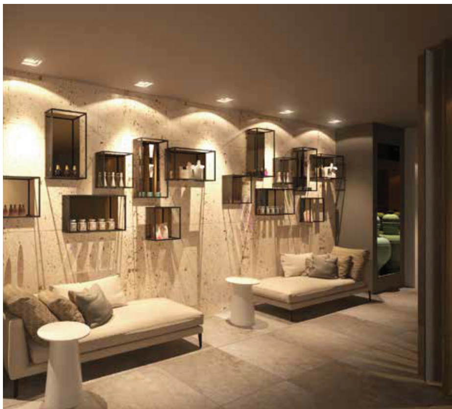
▲ Detailliertes Konzept aus Dekoration und Licht / Detailed concept of decoration and lighting

The furniture, matching the wallpaper, reflects the lightness of the impressive ceiling height. High-hanging, cantilevered lampshades add breaklines and stylish accents. Another highlight is the open fireplace that is integrated into a custom-made veneer case, creating a pleasant ambiance.