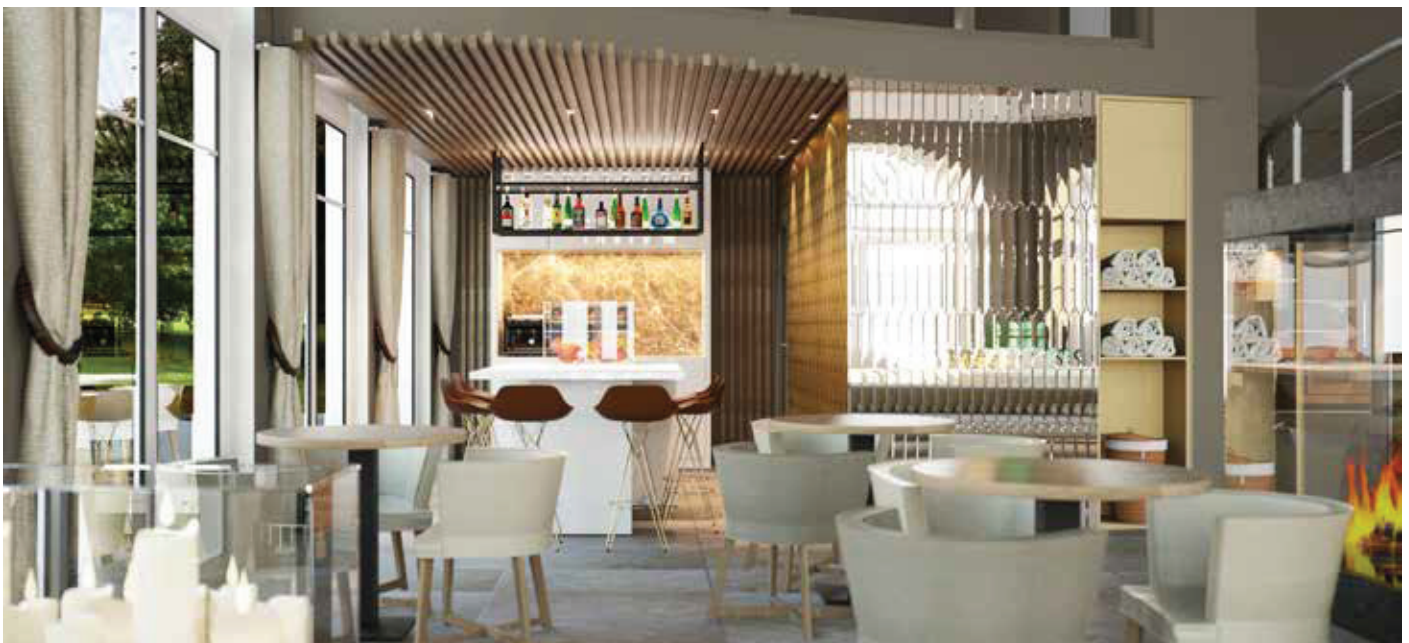
▲ Zurückhaltende Farben sorgen für Beruhigung / Unobtrusive colors help guests to unwind