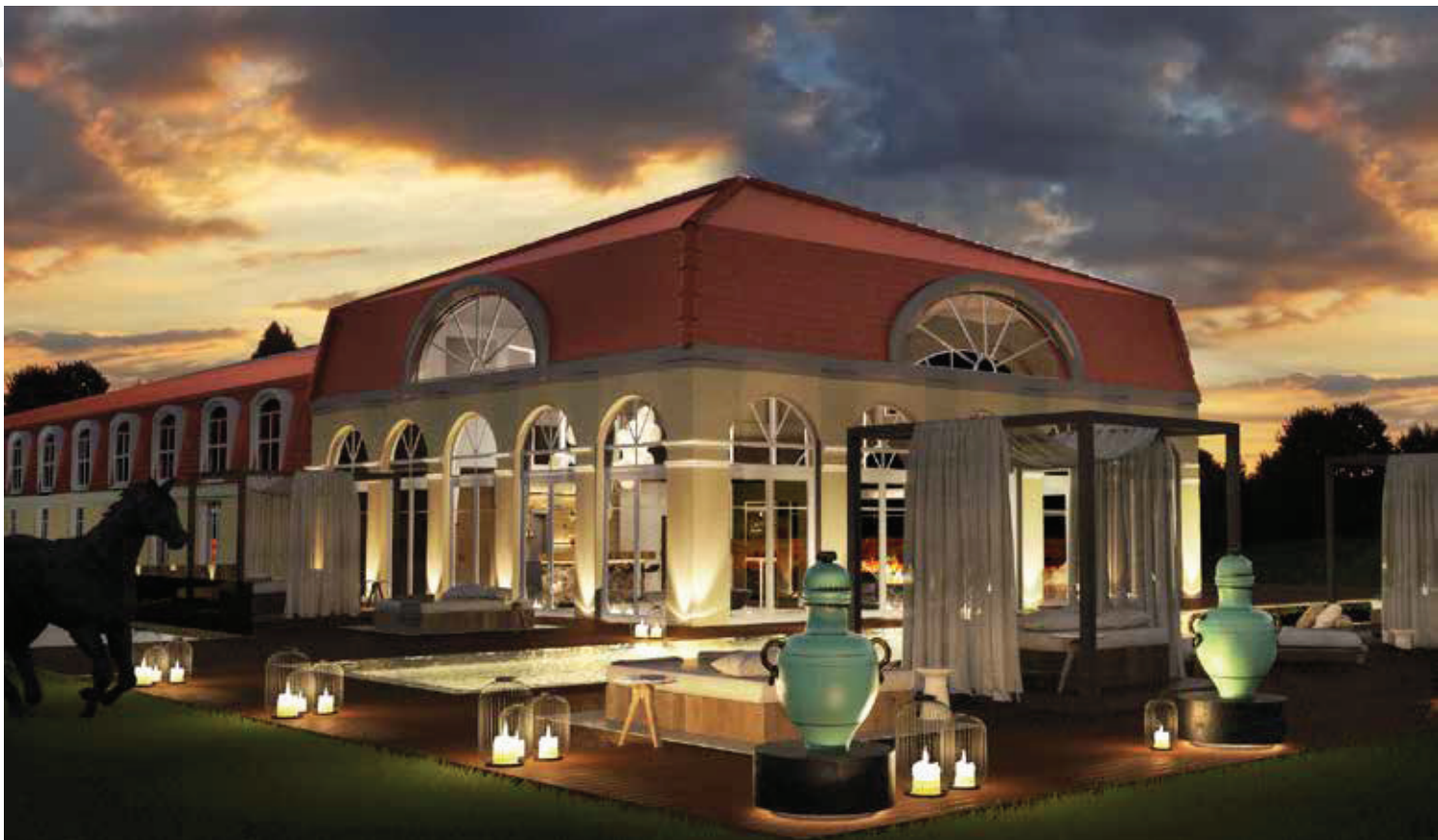
▲ Gehobenes Ambiente zu jeder Tageszeit / Sophisticated location at all hours

Ein barockes Schlosshotel wurde nach einer Komplettrenovierung durch Luxus-Spa und Orangerie ergänzt