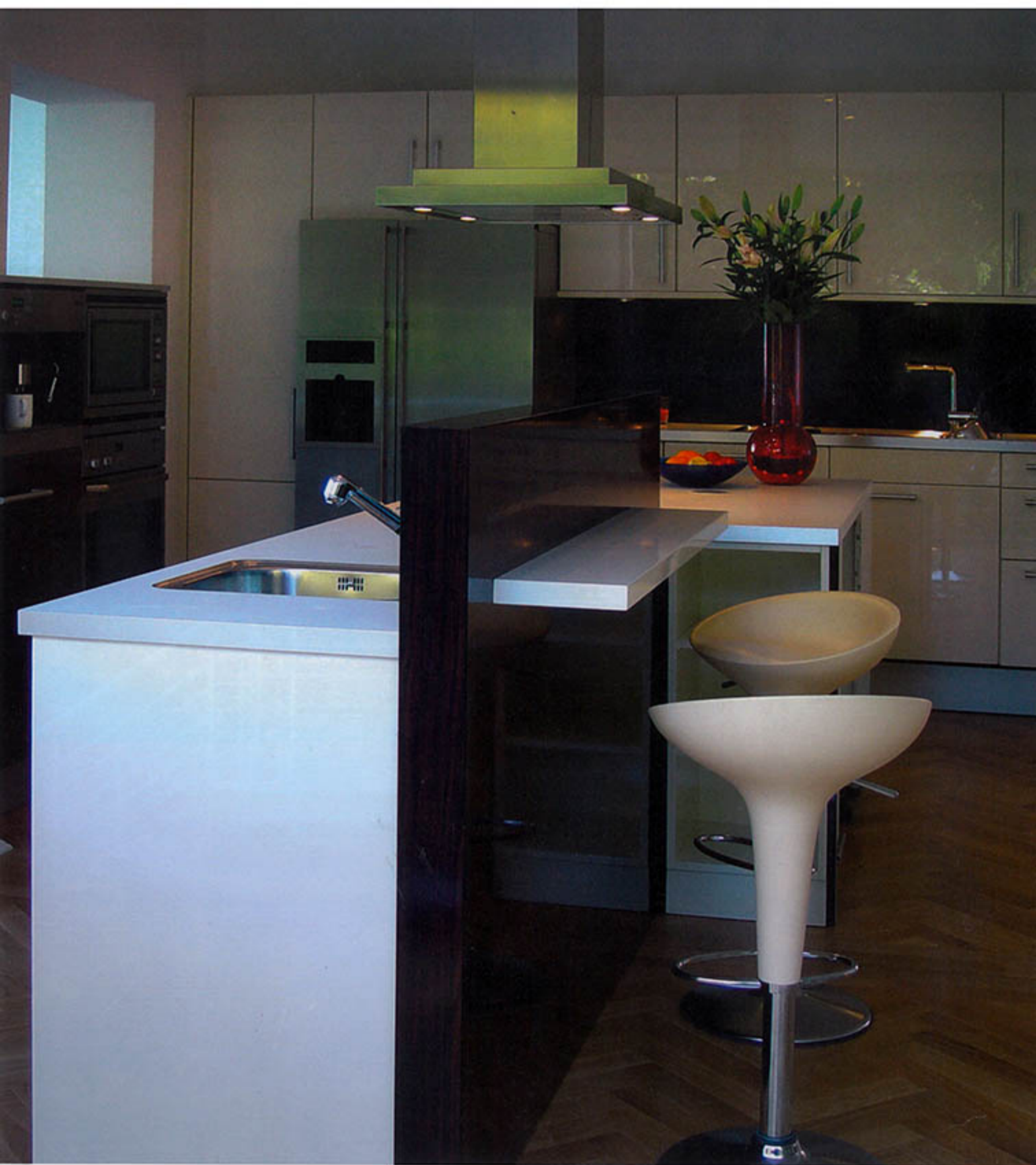
Мини-барът, изработен от покрито с лак дърво "takkasar", спомага за обособяването на пространствата на кухнята и дневната. "Истинско удоволствие е човек да изпие кафето си тук, прелиствайки сутрешния вестник", разказва дизайнерът.