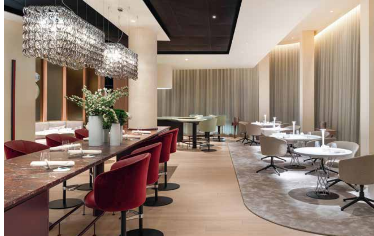
Vitra, Mikado Armchair, Dining Table von Isamu Noguchi, Metal Side Tables, Wooden Side Table, Davide Groppi TeTeTe!, Vistosi Giogali, dormakaba Schiebetüren, Siller & Laar Großküchentechnik und Gastronomiebedarf, V-Zug Haushaltsgeräte, Le Nouveau Chef Kochschürze Davos, Bose, Studio Pieter Stockmans

Wie Kunstwerke servieren Thomas Bühner und sein Team ihre Kreationen auf der von Studio Pieter Stockmans geformten Tableware. Das Interior Design tritt zurück und lässt den kulinarischen Highlights den Vortritt.