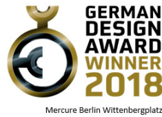
Mercure Berlin Wittenbergplatz