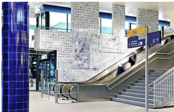
Wall Design for Deutsche Bahn AG