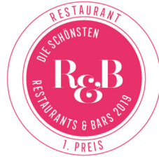
Restaurant Blüchers, Schloss Fleesensee