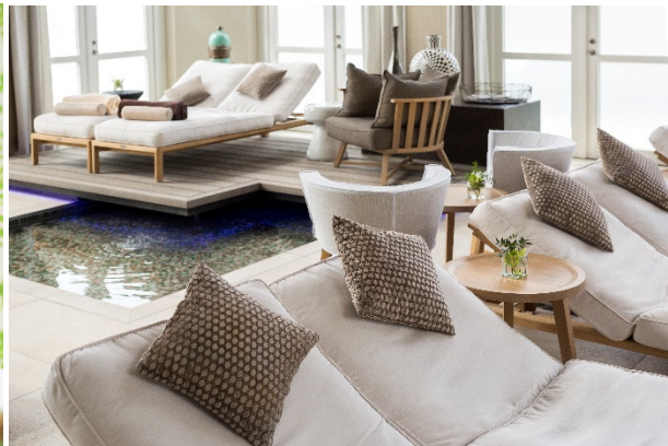
Spa Schloss Fleesensee