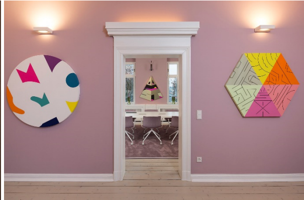
Office Kitzig Design Studios, Lippstadt