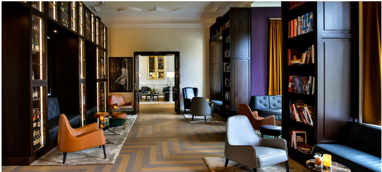
Lounge Schloss Fleesensee

Dieses umfassende Know-How macht Kitzig Design Studios international zu einem starken, zuverlässigen Partner, was durch einen nationalen wie internationalen Kundenstamm bestätigt wird.