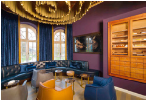
| Smokers Lounge